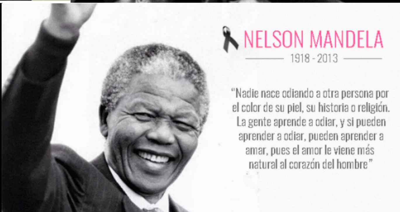
- Nelson Mandela (1918-2013). Activista, abogado y político sudafricano.

«La muerte es algo inevitable. Cuando un hombre ha hecho lo que él considera como su deber para con su pueblo y su país, puede descansar en paz. Creo que he hecho ese esfuerzo y que, por lo tanto, dormiré por toda la eternidad».