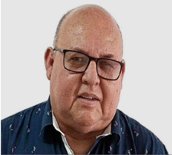
Por: Fernando Alexis Jiménez

Tenemos gente emprendedora, ingeniosa, que ama el medio ambiente. Ese es un aspecto relevante que se le mostró al mundo.