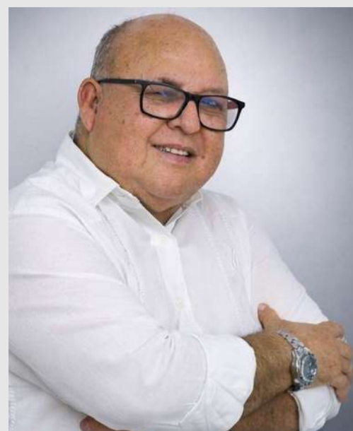
Por: Fernando Alexis Jiménez

En algunas regiones pasó sin pena ni gloria la conmemoración del Día Nacional de las Víctimas del Conflicto Armado.